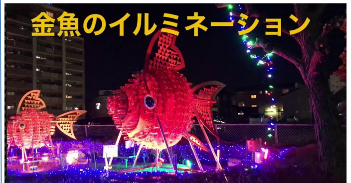
【弥富駅前に飾られたイルミネーション】

ただし、透明度の高い(炭酸のジュースなど)容量500ml程度のものに限ります。200本を目標に9月末まで集めます。ご協力よろしくお願いします。