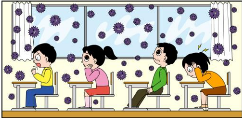
＜換気をしていない教室＞