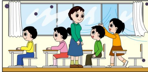
＜換気をしている教室＞